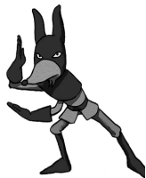
CAPTAIN N Le révolté