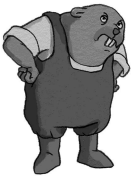
MOMO Le castor