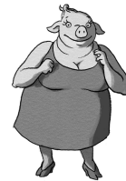
ROSETTA La veuve